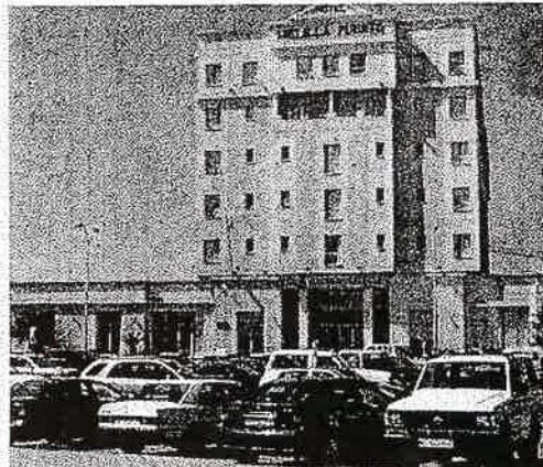
La jornada se celebrará en el Tryp Melilla Puerto.

Es una iniciativa que promueve el Ministerio de Industria, Turismo y Comercio, a través de la Dirección General de la Pequeña y Mediana Empresa y la Ciudad Autónoma de Melilla, a través de la Consejería de Economía, Empleo y Turismo, coordinado por el Pro-